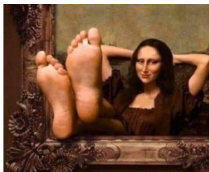
Konečně sama, Louvre, Paříž