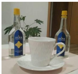
Letošní dovolená káva s výhledem na Alpy.