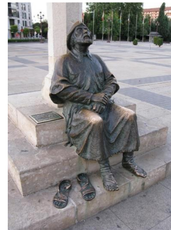
Foto: Branislav Zuštin (socha poutníka na pouti do Santiaga de Compostela)

Novou renesancí zažívá poutnictví. Lidé touží po prožitku a na pouti se vystavují duchovním impulsům na místech zvláštní Boží milosti. Poutě mají u nás dlouhou tradici. Čeští a moravští tajní evangelíci putovali za Večeří Páně a Božím slovem do Saska, Slezska či Horních Uher. Starozákonní otcové víry také putovali, byli na cestě. Boží lid zase putoval do zaslíbené země. O Ježíši Kristu je napsáno: „Syn člověka nemá, kde by hlavu složil.“ Pouť je obrazem našeho životního putování. Připomíná nám, co v životě doopravdy potřebujeme a co ne. Ukazuje nám, že jsme ve skutečnosti závislí jen na Bohu. Na pouti lidé prožívají možnost vystoupit ze svého stereotypu a prožít něco nového. Pouť tak vede v pravém smyslu k obrácení.