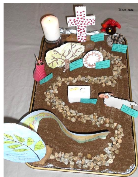
Kámen je odvalen