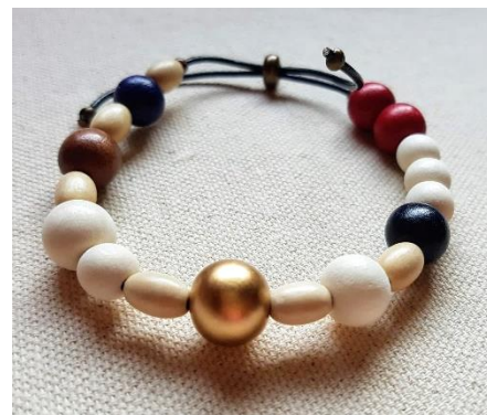
Foto: ukázky modlitebních perel

Modlitba je setkání s Bohem, jde o hledání vztahu. V modlitbě před Pánem lze vyslovit všechno – naříkat, prosit, zoufat, radovat se, děkovat, chválit, přimlouvat se a zpovídat. Pomůckou pro modlitbu mohou být knihy modliteb, modlitební deník, seznam modlitebních oblastí nebo třeba modlitební kostka. Děti se tak mohou učit modlitby formulovat. Existuje i moderní protestanská varianta růžence – modlitební perly. Je více verzí. Jednu popsal švédský lutherský biskup roku 1996. V této verzi nás vede 18 barevně odlišených perel k myšlenkám na Boží přítomnost, křest, lásku, viny, sny, přání, strachy, smrt. Jednou z výhod této modlitební pomůcky je, že si člověk udělá na modlitbu opravdu čas a zvykne si na pravidelnost.